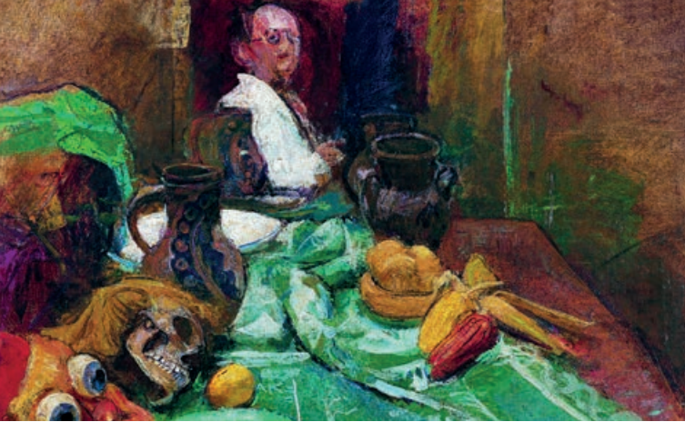
Anton KOLIG, Stilleben mit Maske und Spiegelporträt, um 1940, Kunstsammlung des Landes Kärnten/MMKK